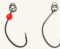
Savage gear Sandeel Ring rigget enkeltkrog

Et godt tip: En enkelt krog i størrelse #1/0 eller #2 kan være en rigtig god ide, hvor der kan være meget ålgræs der driver, samt hvis der er mange fioliner.