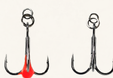
Savage gear Sandeel Ring rigget trekrog

KROGE: Valget af kroge er vigtigt for både fiskens ve og vel og din succes. Skarpe, stærke kroge sikrer bedre krogning, og enkeltkroge kan være mere skånsomme for fisken, især hvis du vil praktiserer catch & release. Brug gerne kroge i rustfrit stål eller med en stærk belægning for at undgå rust og slitage.